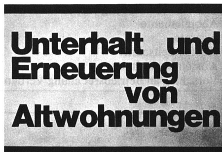
Das empfehlenswerte Fachbuch des SVW