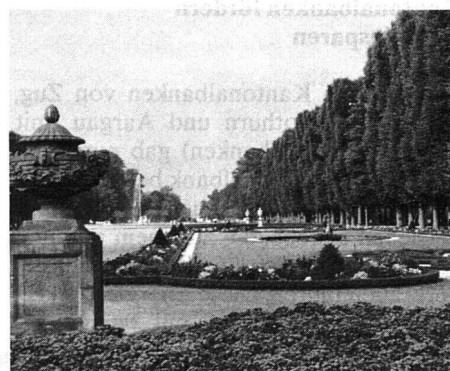
Ausblick auf die Längsachse des Gartens vom Schloss aus mit den prächtigen Linden-Alleen.

spielt die freie Natur zusammen mit der gezügelten Natur in Form von architektonisch verwendeten Pflanzen als Alleen, Hecken und ornamentale Blumenbeete; andererseits harmonisieren Pflanzen mit den vielen Skulpturen und Zierbauten.