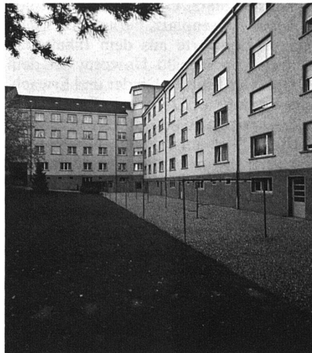
Hofraum der Liegenschaften Wydenstrasse heute

«In einer Wohnstrasse ist also weder das Fahren noch das Parkieren grundsätzlich verboten. Durch die baulichen Massnahmen wird der Verkehr erschwert und damit auch beruhigt. Auf den markierten Parkplätzen sollen die Anwohner ihre Autos abstellen können. Nur die Anwohner? Das ist eine der Schwachstellen des Wohnstrassenkonzeptes. In jeder normalen Quartierstrasse sind die Fremdparkierer das grosse