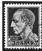
Gajus Julius Cäsar

Langsam aber sicher stieg die militärische, aber auch politische Machtfülle des erfolgreichen Feldherrn. Schliesslich wurde er Alleinherrscher des riesigen