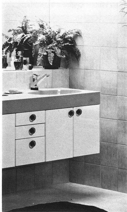
Oben: Moderner Waschtisch von heute