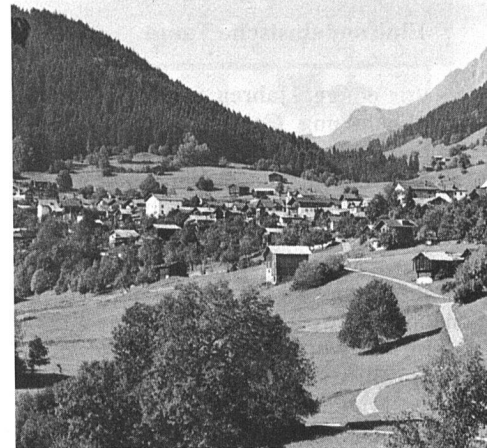
Waltensburg im Sommer...

Durch Erwerb eines Anteilscheines von 1200 Franken wird man Genossenschafter. Den jährlichen Zins für die Einlage erhält man wahlweise in Form einer Vergünstigung auf dem Arrangementpreis von 10% während der Hochsaison und 20% während der übrigen Zeit für einen 14tägigen Ferienaufenthalt. Der