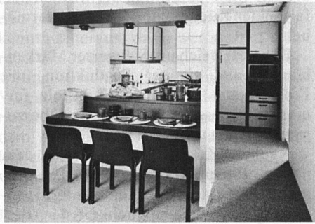
Troesch-Küche «Contura Quadro»

Besonders aktuell sind auch pastellfarbene Kunstharzfronten mit Echtholzprofilen. Troesch zeigt aus seiner «Contura-Linie» vier verschiedene Frontarten, die diesem Trend entsprechen. Ganz neu: die «Contura Quadro» mit Holzrahmen.