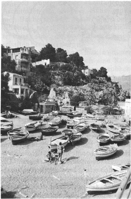
Kleiner Fischerhafen unweit des Touristenparadieses Taormina.