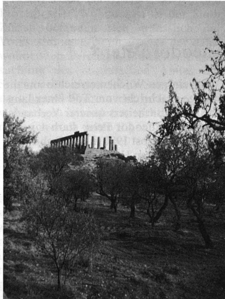
In Sizilien trifft man sozusagen bei jedem Schritt auf eindruckliche und grossartige Zeugen griechischer, römischer, arabischer, normannischer und spanischer Vergangenheit.

Sizilien – das ist ein blühender Garten, das sind auch Landstriche von beeindruckender Kargheit; fröhliche, laute und temperamentvolle Menschen leben hier und scheue, misstrauische. Es ist ein Land des Lichts, voll von Schönheiten und Hässlichkeiten, mit zahllosen Stätten uralter Kulturen, mit griechischer, römischer, arabischer und christlicher Vergangenheit, voller Frömmigkeit und Verbrechen.