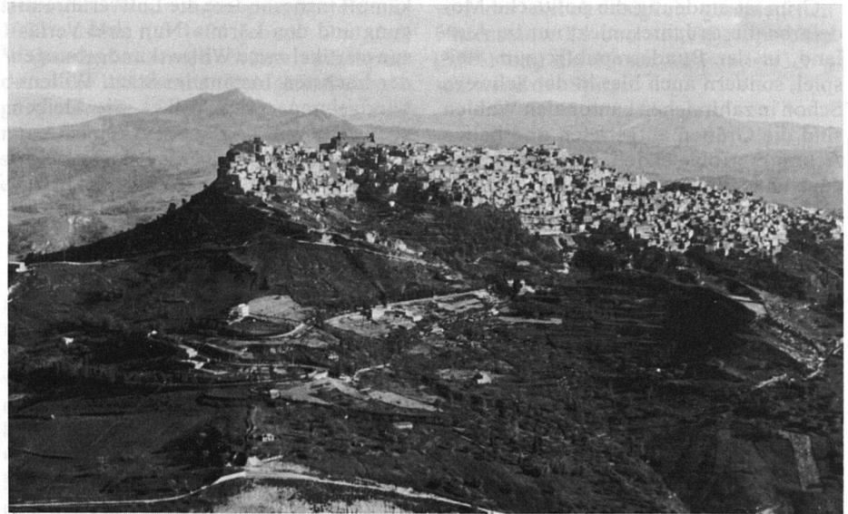
Insel der Gegensätze: Karge Landstriche und blühende Gärten. Die meisten Städtchen im Landesinnern Siziliens sind auf Hügelkuppen und Bergspitzen erbaut.

In den fruchtbaren Gegenden der Orangerhaine, Weinberge, Tomaten-, Erdbeer- und Melonenfelder stehen die einfachen Behausungen der Landarbeiter und Tagelöhner, die im unerbittlichen Sonnenlicht ihre schwere Arbeit verrichten und trotz der reichen Erträge der sizilianischen Erde nur ein kärgliches Auskommen haben.