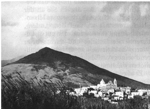
Der Ätna auf Sizilien und der unweit davon auf einer Nachbarinsel tätige Vulkan Stromboli zeugen beide täglich davon, dass auch das Erdinnere in dieser Gegend noch lange nicht zur Ruhe kommt. Auf unserem Bild der Stromboli.

Auf einer Insel, auf der Griechen, Römer, Normannen, Araber, Spanier und noch einige Völkerstämme jahrhundertlang gelebt und gewirkt haben, erscheint das logisch.