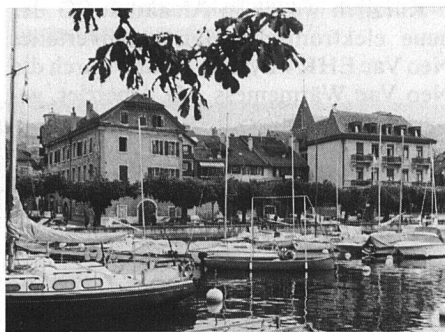
Altes Dorfkern der Gemeinde Lutry (VD Schweiz) wird mit Wärme aus dem Genfersee beheizt.

Für die Nutzung von Seewasser als Wärmequelle von Wärmepumpen verfügt Sulzer über grosse Betriebserfahrungen mit verschiedenen Verdampferbauarten wie Plattenverdampfer oder überflutete Verdampfer. Damit lässt sich fallbezogen das am besten geeignete System anbieten: in Lutry am Genfersee zum Beispiel eine Wärmepumpenanlage mit überflutetem Verdampfer.