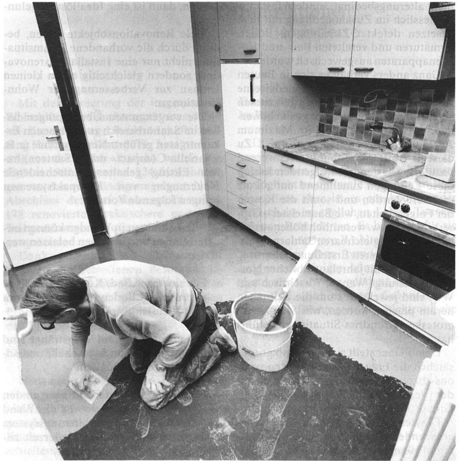
Küche und Badezimmer: Diesen beiden Räumen kommt bei Renovationen und Sanierungen im Hinblick auf Zukunftssicher-

Die bis 1938 mehrheitlich verwendeten Gussablaufleitungen sind meistens