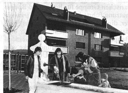
In Kloten werden in einer Wohnüberbauung jährlich 160000 Liter Heizöl gespart und dazu erst noch Mineralwasser ab Brunnen abgeben.

Die geothermische Energiegewinnung beruht auf der Nutzung der Tatsache, dass die Gesteinstemperatur mit der Tiefe zunimmt. Diese Wärme führt auch zu einer Temperaturzunahme des im Gestein zirkulierenden Wassers. Dieses erwärmte Wasser kann zu Heizzwecken herangezogen werden, indem ihm durch eine Wärmepumpe Energie entzogen wird. Dadurch werden im konkreten Fall aus 1 kW Stromverbrauch rund 3 kW Wärme erzeugt. Gemäss einer Botschaft des Bundesrates vom 17. September 1986 an die eidgenössischen Räte könnten durch die Nutzung von nur 1 Prozent der in der Schweiz verfügbaren Wärmeressourcen rund 13 Prozent unseres Energiebedarfs für Raumheizung und Warmwasserbedarfs gedeckt werden.