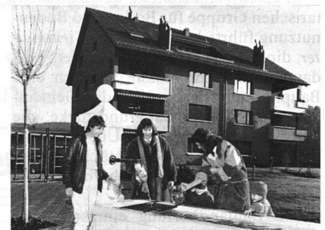
In Kloten werden in einer Wohnüberbauung jährlich 160000 Liter Heizöl gespart und dazu erst noch Mineralwasser ab Brunnen abgeben.

Die geothermische Energiegewinnung beruht auf der Nutzung der Tatsache, dass die Gesteinstemperatur mit der Tiefe zunimmt. Diese Wärme führt auch zu einer Temperaturzunahme des im Gestein zirkulierenden Wassers. Dieses erwärmte Wasser kann zu Heizzwecken herangezogen werden, indem ihm durch eine Wärmepumpe Energie entzogen wird. Dadurch werden im konkreten Fall aus 1 kW Stromverbrauch rund 3 kW Wärme erzeugt. Gemäss einer Botschaft des Bundesrates vom 17. September 1986 an die eidgenössischen Räte könnten durch die Nutzung von nur 1 Prozent der in der Schweiz verfügbaren Wärmeressourcen rund 13 Prozent unseres Energiebedarfs für Raumheizung und Warmwasserbedarfs gedeckt werden.