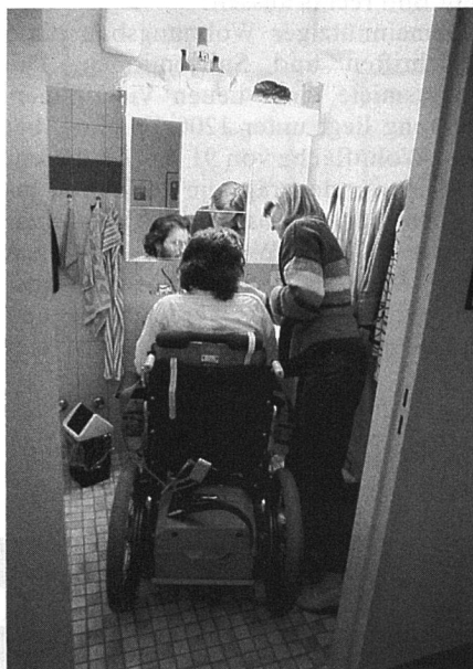
Richtige Einteilung des Sanitärraumes ist ohne Mehrkosten erreichbar