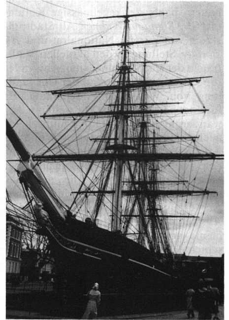
Der letzte Tee-Segler, zu besichtigen in Greenwich bei London.

Wie auch bei anderen Stilarten neigten gewisse Exponenten zu Auswüchsen und Übertreibungen. So kam auch hier Kritik auf, und ab den dreissiger Jahren begannen die Konsumenten die Nase zu rümpfen. Der Jugendstil wurde zum Kuriosum. Heute aber stehen seine Schöpfungen – vermutlich als Reaktion auf unsere kühle Sachlichkeit – wieder hoch im Kurs.