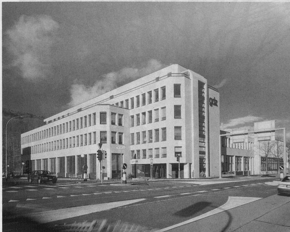
Links: Die neue gdz in der Manegg, von Südosten.