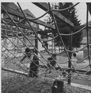
Netze und Seile für Spielplätze, Ballfang- und Sportnetze, Schutznetze usw.

nen auf spielerische Weise, sich in das soziale Gefüge, in das gesellschaftliche Leben einzufügen. Sie sozialisieren sich weitgehend durch das Spiel. Im Spiel wird gestritten, versöhnt, gelacht, geweint, experimentiert. Es werden Grenzen gesucht. Ein Spielplatz hat aber nicht nur für Kinder eine wichtige Funktion. Ich möchte das Wort Spielplatz weiter fassen: Quartierplatz, Begegnungsort. So verstanden, wird dieser Platz plötzlich für uns alle von Bedeutung. Der Spielplatz wird zu einem Begegnungsort zwischen Erwachsenen untereinander, zwischen Jungen und Alten, zwischen Eltern und Anwohnern, zwischen Neuansiedlern und Alteingesessenen. Ein Ort, wo Kontakte geknüpft werden, wo Ideen und Erfahrungen ausgetauscht werden und vor allem: Ein Ort, der der Isolation vieler Menschen in den Städten entgegenwirkt. Von dieser Idee sind wir allerdings noch weit entfernt. Vielleicht bleibt es auch eine Utopie.