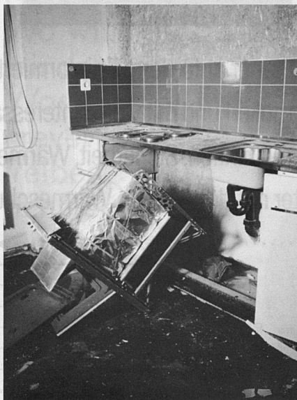
Zuerst werden die Apparate ausgebaut.

Die Küche ist ein Teil des sogenannten Nassbereiches einer Wohnung: sie hängt an einem komplexen System von Zu- und Ableitungen der Wasserversorgung und Abwasserentsorgung. Sie ist auch mit dem elektrischen Leitungsnetz verbunden und mit einem Be- und Entlüftungssystem. Zieht man also einen Küchenumbau vorerst aus rein optischen Gründen in Betracht, weil die Fronten beschädigt oder veraltet sind, oder aus technischen Gründen, weil die Apparate den Anforderungen nicht mehr genügen,