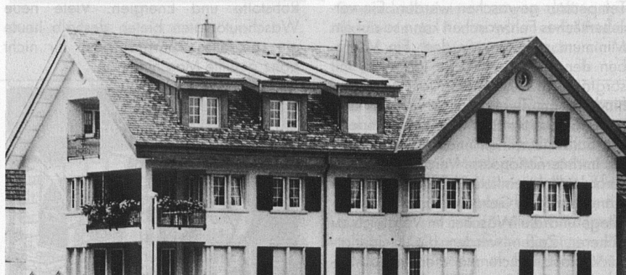
Warmwasser aus 20 m 2 Sonnenkollektoren. Ein sinnvoller Beitrag zur Reduktion des Schadstoffausstosses der Heizungen.

Ernst Schweizer AG, Metallbau 8908 Hedingen