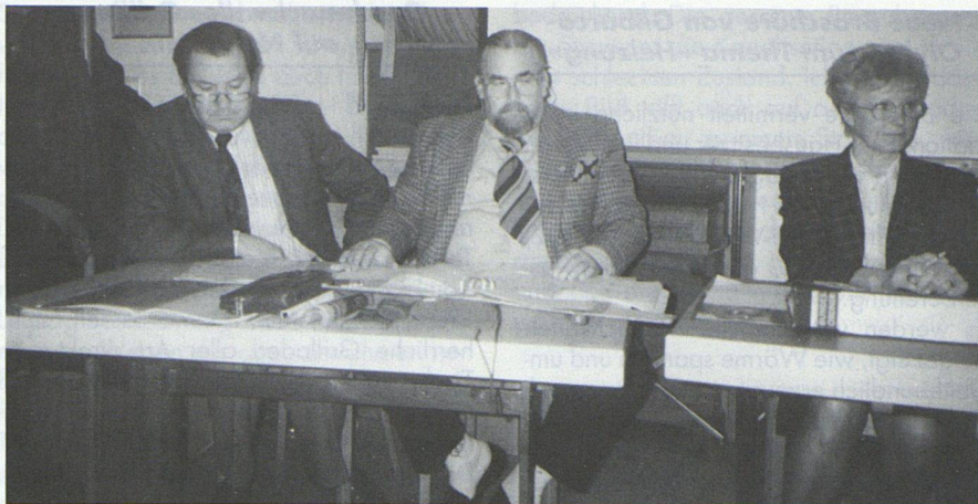
Szene aus dem gelungenen Sketch der «Rösli-Chöl»-Theatergruppe, gespielt von Genossenschafterinnen und Genossenschaffern der Kolonie Owenweg/Balberstrasse.