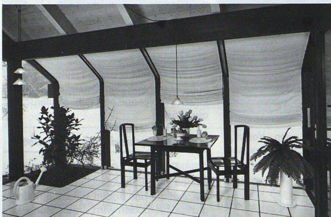
Der Raff-Vorhang ist an sich nicht neu, er lässt sich vielseitig einsetzen.