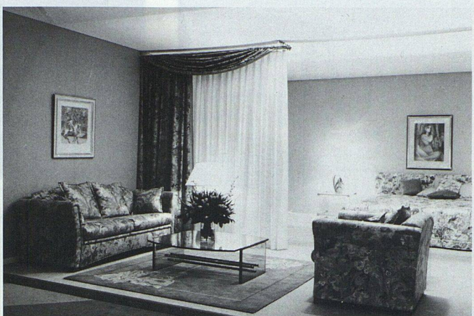
Eine ungewohnte Drapierung kann auch einen Raum gliedern. Hersteller: Lampert, Basel Verkauf aller Heimtextilien durch den Fachhandel.