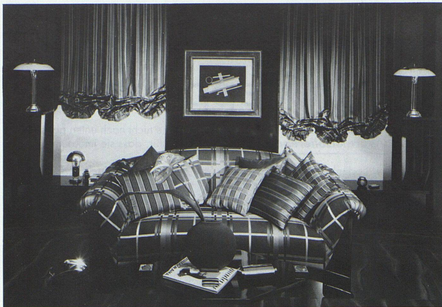
Abgestimmte Textilien und phantasievoller Einsatz im Raum schaffen eine spannungsvolle Atmosphäre.

Hersteller: Christian Fischbacher+Co. AG, St. Gallen