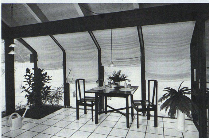
Der Raff-Vorhang ist an sich nicht neu, er lässt sich vielseitig einsetzen.