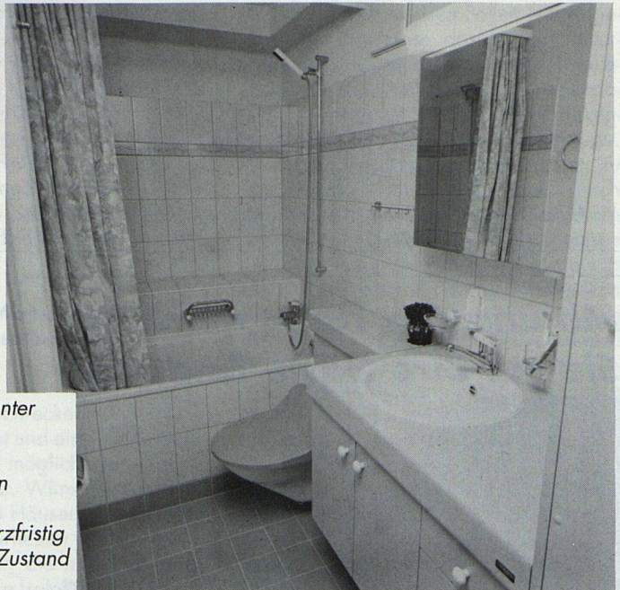
Nur dank konsequenter Anwendung von teilverfabrizierten Installationseinheiten war es möglich, die Wohnungen kurzfristig und in bewohntem Zustand zu erneuern.

Aussenwände durchschnittlicher K-Wert vor der Sanierung 0,94 W/m 2 K nach der Sanierung 0,32 W/m 2 K