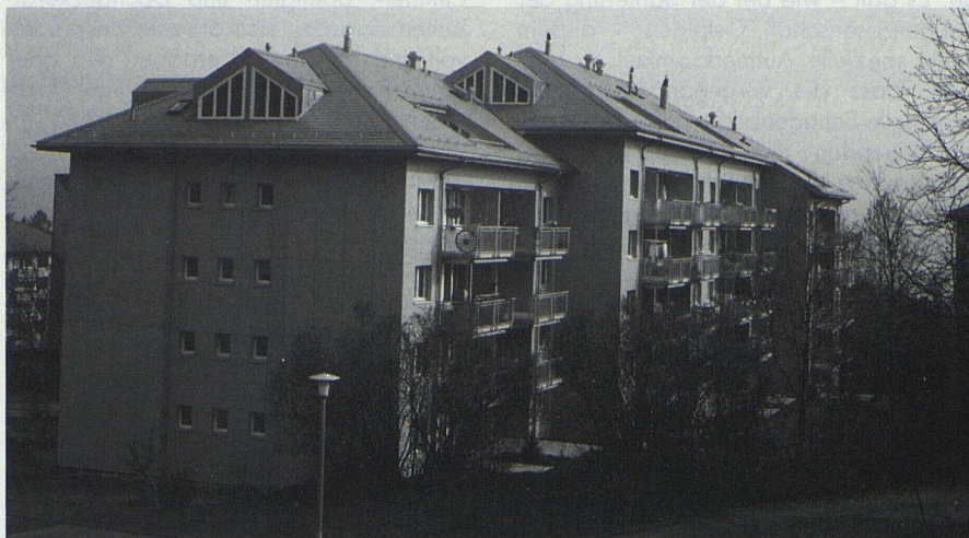
Das frisch renovierte Gebäude der Gewerbebaugenossenschaft in Horgen. In den Dachstöcken konnte je eine geräumige 3 1/2-Zimmer-Dachwohnung zusätzlich errichtet werden: Ein gutes Beispiel für eine sanfte Verdichtung des Wohnraumes in bereits überbautem Gebiet.

Bevor mit der eigentlichen Planung begonnen wurde, stellte man sich die Frage nach der kommenden Nutzung: Welchen stimmt der Komfort mit den Bedürfnissen der Mieter überein, hat die Gesamtgestaltung noch Gültigkeit? Die Antwort auf