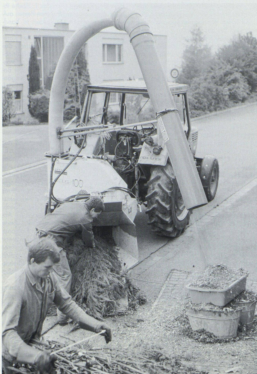
Viele Gemeinden bieten einen Häckseldienst an. Er gewährleistet, dass Schnittgut von Bäumen und Sträuchern aus dem Quartier verwendet werden kann. Das ist entscheidend für eine umweltgerechte, dezentrale Kompostierung. Im Bild: Häckseldienst in der Gemeinde Bachenbülach ZH.

Mit der Kompostierung organischer Reste aus Küchen, Gärten und von Grünflächen an ihrem Entstehungsort können wir einen Lebensraum gestalten und eine Verwertung miterleben. Gerade in dichtbesiedelten Wohnquartieren ist es indessen oftmals nicht leicht, einen geeigneten Standort für den Kompostplatz zu finden. Lesen Sie diesen Aufsatz, bevor Sie angesichts der Einwände Ihrer Nachbarn resigniert die Grünabfuhr in Anspruch nehmen... Kompostieren ist keine Kunst!