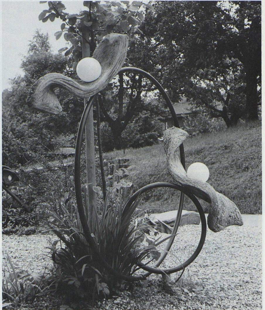
«Licht und Schatten begleiten uns in allen Bereichen.»

«Aus dem Bauch heraus» will sie arbeiten, Intuition ist ihr das Wichtigste. Das gilt besonders für ihre aussergewöhnlichen Lichtobjekte, die an verschiedenen Orten im Freien aufgestellt werden. Diese Kunstwerke lassen sich am treffendsten mit einem Wort von Paul Klee beschreiben: «Wir konstruieren und konstruieren, und doch ist die Intuition immer noch eine gute Sache.»