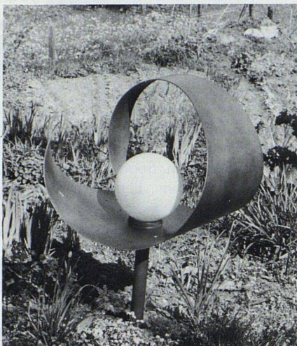
Nicht nur grosse, auch kleine Beleuchtungskörper.