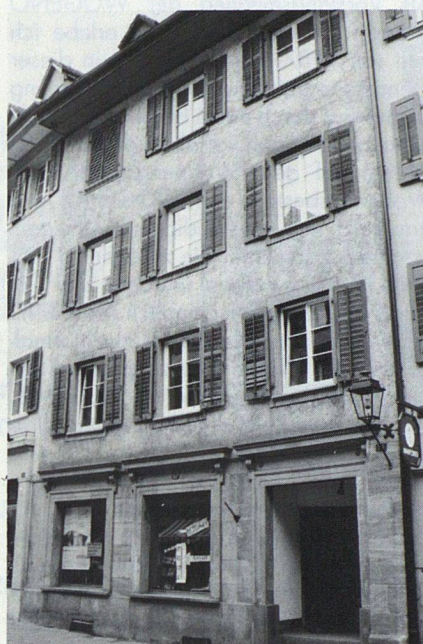
Marktgasse 23, Rheinfelden: 3 Wohnungen, 1 Laden mit Büro

te zahlen zu müssen und aktiv am bevorstehenden Umbau der Liegenschaft mitwirken zu können. «Mitbestimmung» hiess dann aber in Wirklichkeit auch: Zahlreiche Sitzungen mit dem Architekten und den Handwerkern, Planungs-Leerläufe, endlose Verzögerungen beim Umbau (und damit verbunden eine erhebli-