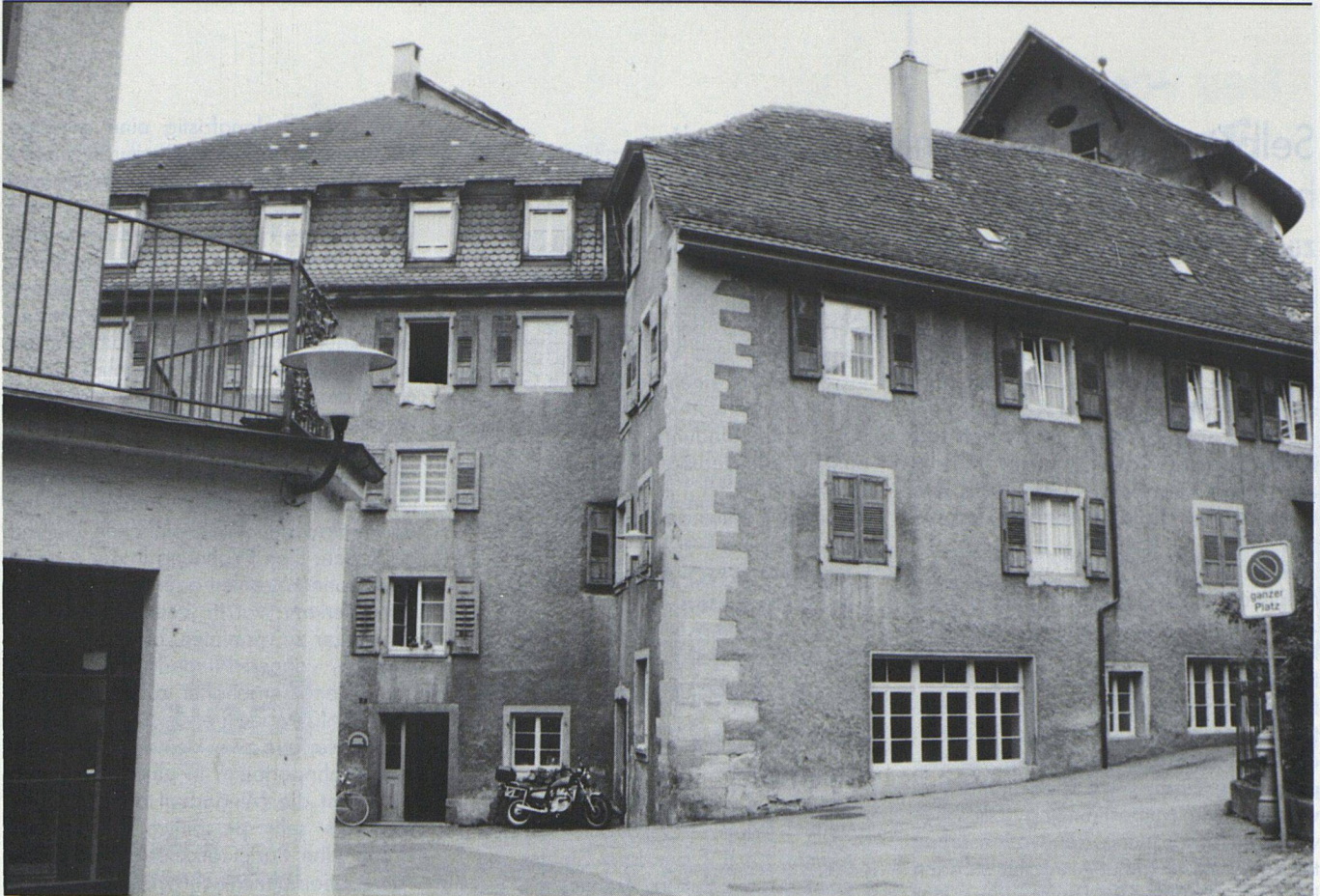
Alte Bausubstanz erhalten und günstigen Wohnraum bieten: An der Wassergasse 8 in Rheinfelden vermietet die 1983 gegründete WOGENO Aargau 13 Wohnungen, 1 Atelier und 2 Gewerberäume.

tigkeitsgefühl steigen indessen auch die Ansprüche. Ohne Aussicht auf eine andere Wohnung werden allfällige Mängel einer Wohnung wieder als schwerwiegend empfunden. Wenn der Traum vom eigenen Haus verblasst, zieht man den Spatz in der Hand vor: die Genossenschaftswohnung. Doch gerade bei Mietwohnungen, also auch bei Genossenschaftswohnungen, liegt eine besonders ausgefallene Gestaltung nicht drin. Unsere Häuser sind mit einem sehr grossen Anteil an Hypothekendarlehen belastet, so dass die Zinserhöhung auch eine enorme Steigerung der Mietzinse gebracht hat, ohne dass Sanierungen oder Verbesserungen vorgenommen wurden. Die Belastung ist so hoch, dass eine umfangreiche Sanierung ohne WEG kaum denkbar ist.