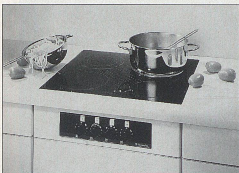
Geringer Energieverbrauch und schönes Design zeichnen die neuen Electrolux Glaskeramik-Kochfelder aus.

Die Auswahl an neuen Electrolux Glaskeramik-Kochfeldern reicht vom einfachen Gerät über verschiedene Komfortstufen bis hin zum Exklusiv-Feld mit spezieller Kochzonenanordnung und Turbo-Zone. Für den nachträglichen Einbau stehen spezielle Modelle zur Verfügung.