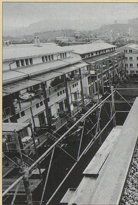
Blick nach Süden über den Innenhof. Links die Bauteile der Genossenschaft «G 91», rechts von «Remishueb»

im «Genossenschafts-Verband Höchst-Remishueb» zusammengeschlossen. Diese Dachorganisation ist für die Infrastruktur verantwortlich, für die Parkgarage in der verkehrsfreien Siedlung, für die zentrale Gasheizung und für die Umgebungsgestaltung. Gemeinsam hat man sich auch für den Erhalt einer alten, zuerst dem Abbruch geweihten Scheune entschieden.