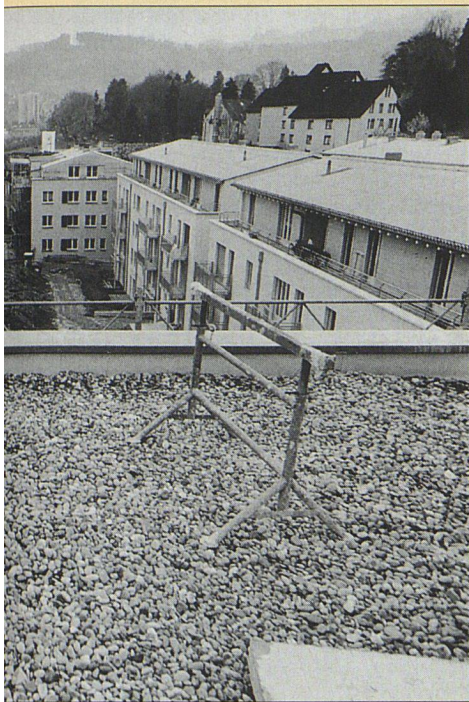
Am Hofende die Kopfbauten von «Achslenblick».

die Verkleinerung der Plätze zwischen den Häusern heute nicht mehr so deutlich spürbar. Das ist für ihn allerdings kein Grund, die St.Galler «Remishueb» nicht trotzdem als «vorbildlich» zu loben. Zur Geltung komme das Gesamtkonzept wohl erst später, wenn auch die grössere zweite Etappe (mit weiteren rund 350 Wohnungen) realisiert sein werde. Für ihn, der mit Peter Götz hier nun auch selbst Bauten der Genossenschaft «Remishueb» realisiert, ist das Modell «ein Beweis dafür, dass es durchaus funktioniert, wenn verschiedene Bauträger mit einem gemeinsamen Konzept arbeiten».