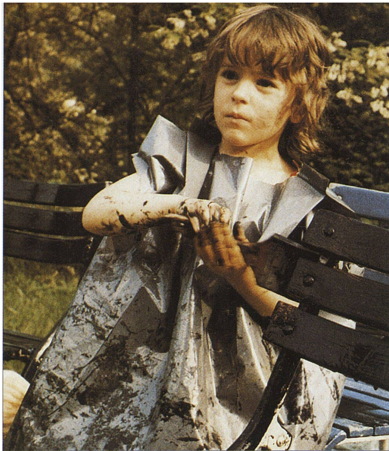
Aus alt mach neu, aber ohne die Umwelt zu belasten.

Arbeiten Sie womöglich mit Pinseln. Durch Spritzpistolen oder Roller gelangt mehr Lösungsmittel in die Umwelt. Sorgen Sie während und nach der Malarbeit für viel frische Luft. Falls Ihre Haut trotz Handschuhen etwas Farbe ab bekommen hat, reiben Sie sie mit Olivenöl oder Babyöl ein, und spülen Sie mit warmem Wasser nach.