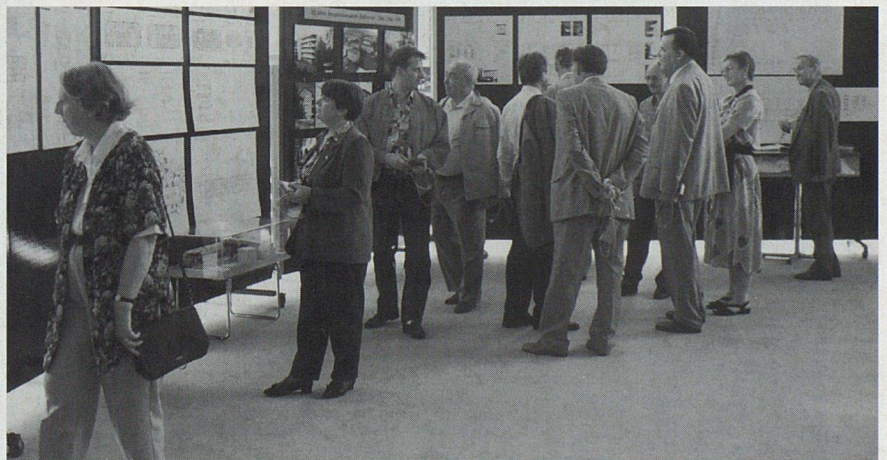
Gäste beim Betrachten der Ausstellung über einzelne Wohngenossenschaften im Forum des Palazzo dei congressi.

Einen ausführlichen Bericht über die Feierlichkeiten in Lugano sowie die Jubiläumsgeneralversammlung vom Samstag, 4. Juni 1994, lesen Sie in der nächsten Nummer des «wohnen».