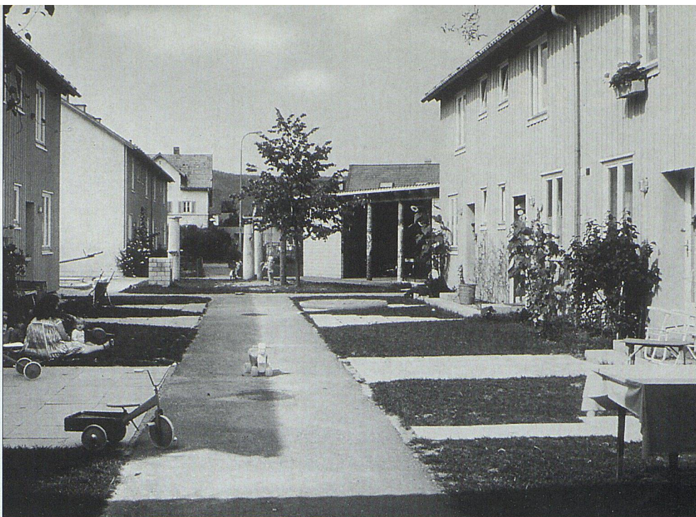
Typisch fürs «Zelgli»: Hier sind Kinder stets präsent.