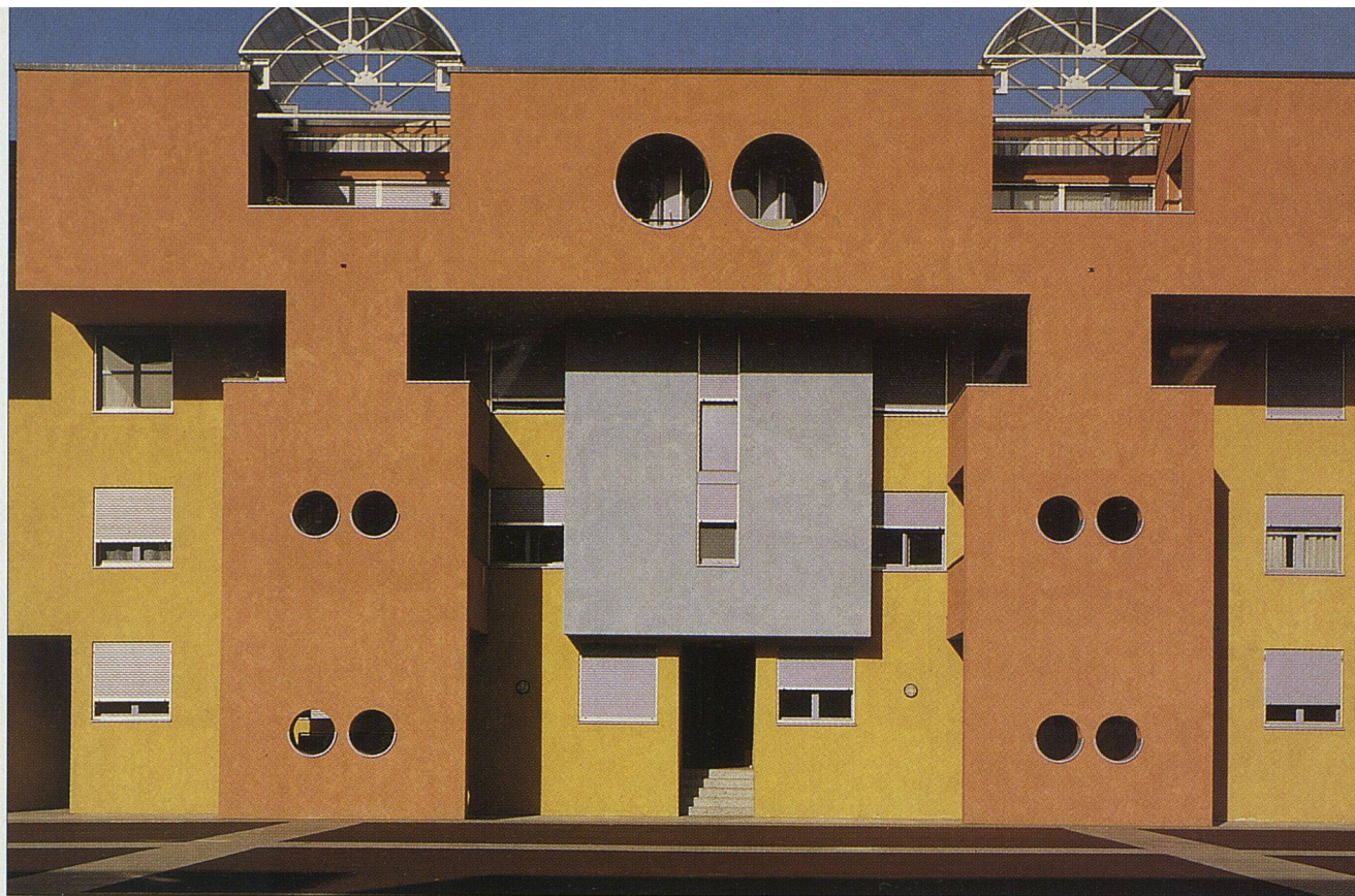
Wohnüberbauung Novazzano in der Nähe von Chiasso. Architekt: Mario Botta. Gebaut 1988–1992; Bauherrschaft: Fidefinanz, Bellinzona.