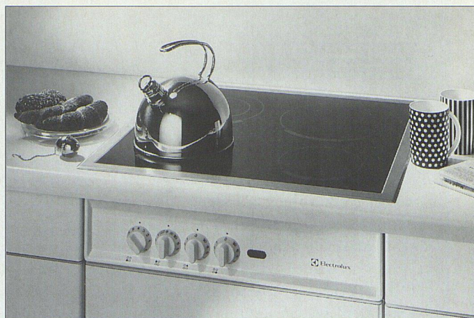
«Sandwich» und Schnappfeder: Diese umweltgerechte Lösung reduziert die Einbauzeit.

Sicher wollten Sie auch schon das eine oder andere Haushaltgerät endlich durch ein neues, besseres ersetzen. Und liessen dann doch vom guten Vorsatz ab, weil Ihnen der Aufwand zu gross und zu kompliziert erschien. Dabei lassen sich die meisten Haushaltgeräte innert 24 Stunden problemlos ersetzen. Dank dem Schweizer Masssystem (SMS) kann zum Beispiel ein neuer Backofen oder Geschirrspüler ohne Nischenänderung an die gleiche Stelle des alten Gerätes eingebaut werden. Für Küchenmöbel, welche ausserhalb dieser Norm gebaut wurden, stehen ausgebildete Einbauspezialisten zur Verfügung, die entsprechende Anpassungen für Normgeräte vornehmen können. Chromstahlmulden mit Gusskochplatten können ohne weiteres durch ein neues Glaskeramikfeld ersetzt werden. In diesem Bereich bietet Electrolux eine Weltneuheit