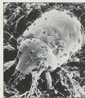
Hausgenossin: Milbe (282-fache Vergrösserung)

Auf Schritt und Tritt umgeben uns Stoffe, die Allergien verursachen. Allgemein bekannte Quellen sind Abgase, Chemikalien, Blütenpollen. Aber auch in den eigenen vier Wänden lauern Probleme durch Hausstaub: Allergische Reaktionen – vor allem Asthma – sind in stetem Vormarsch begriffen. In Teppichen, Polstermöbeln und Vorhängen sammeln sich winzig kleine Fasern an; auch Haustiere sind emsige Staubproduzenten. Dazu kommen die Hautschuppen der Bewohnerinnen und Bewohner. Dass sich trotz grossem Hygienebewusstsein Staub anhäuft, hat unter anderem auch mit gewachsenem Umweltbewusstsein zu tun: Fenster sind optimal isoliert; gelüftet wird nur noch kurz. Die Folge ist ein mangelhafter Luftaustausch. Auf diese Weise entstehen auf Teppichen, Polstermöbeln und Vorhängen eigentliche