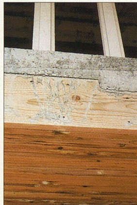
Beton und Holz ideal kombiniert.

nung (nach der in Gilamont-Village verwendeten Bauweise) erforderlich ist, nämlich rund 30 Kubikmeter. Für den Bau der Siedlung wurden insgesamt 2000 Kubikmeter Schweizer Holz verwendet: Das ist eine absolute Neuheit