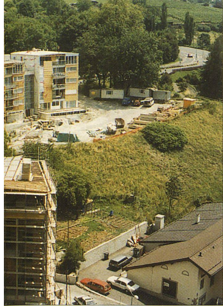
gerade im ersten Haus (ganz rechts im Bild) sind

gegen Lärm und Luftzug erfolgt durch die lange Glasveranda entlang des Gebäudes auf der Nordost-Seite.