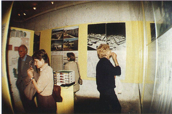
Gute Besucherzahl in der Ausstellung «Standard contra Innovation».

Allerdings muss ich zugeben, dass mir an der Dame SVW anderes weniger gefällt. Sie ist zum Beispiel so glücklich. Sie will nur noch ihre Sache zusammenhalten. Wer nicht zur Familie gehört, dem fehlt der Stallgeruch, und er wird nicht angenommen. Noch immer glaubt sie an die Familienideologie: Papi, Mami und zwei, drei Chnöpf. Diese bleiben ewig im Schulalter, und dafür sind die Wohnungen auch entworfen. Wie kommen die Genossenschaften zu ihren Bauprogrammen, wie zu ihren Architekten? Ein filziges Kapitel. Allerdings ist dafür die Dame SVW nicht zuständig, zugegeben, doch sie und ihre Familie sind geradezu mit sich selbst imprägniert und lassen selten etwas von aussen in sich herein. Sie wissen selber und allein, wie es zugeht in der Welt. Gegen deren Tücke helfen nur die Altbewährten und das Sparen. Lieber heute einen Franken verdienen als morgen fünf. Neue Leute und andere Gedanken bringen nur Unruhe. Haushalten gilt in diesen Kreisen bereits als