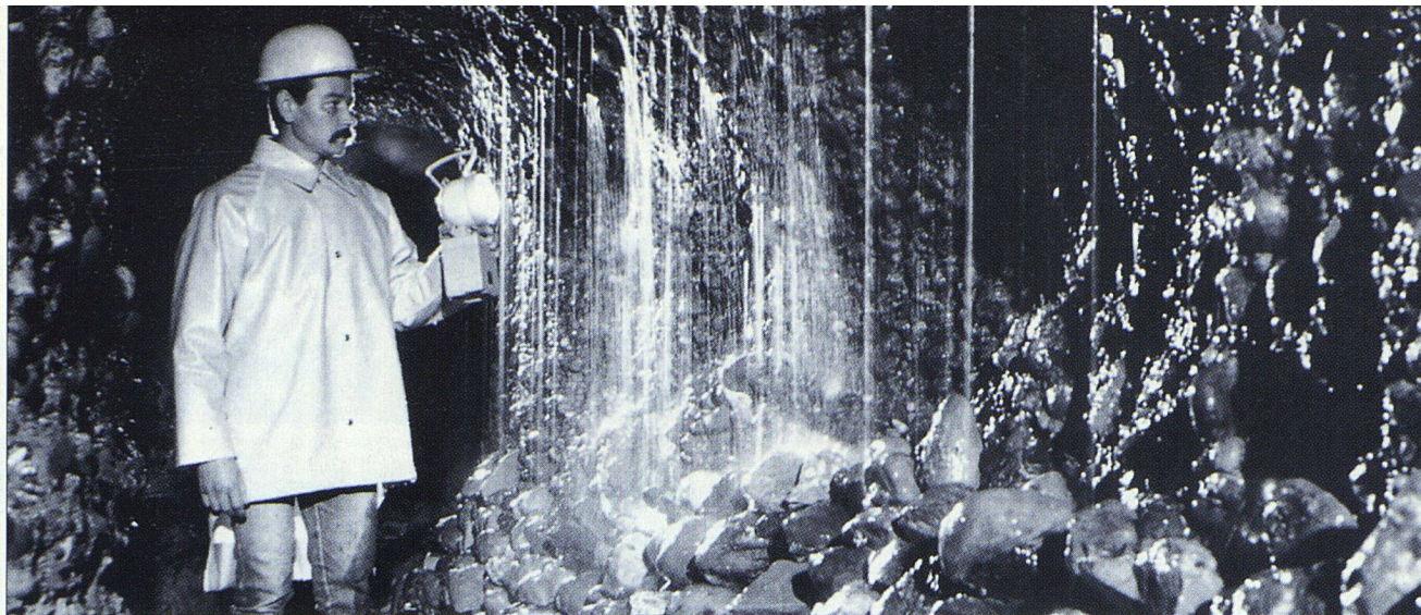
Kohlboden- quelle im Lorzetal.