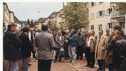
Im Hof der verkehrsberuhigten EBG Altstetten.

Im Rahmen des Weiterbildungsprogrammes der Sektion Zürich SVW fand am 17. Oktober 1995 eine Besichtigung zweier Bauvorhaben statt, welche bei Vertreterinnen und Vertretern der Baugenossenschaften auf reges Interesse gestossen ist. Auf dem Gelände des ehemaligen Bahnhofs Selnau erbaute die Stadt Zürich mit einem überzeugend gelösten Projekt 64 Wohnungen sowie Einrichtungen für die Kinderbetreuung. Eine völlig andere Problemstellung zeigte sich bei der Renovation der Siedlung der Eisenbahner Baugenossenschaft Altstetten. Durch den Anbau von Balkonen und Wintergärten konnte der Wohnwert der Wohnungen wesentlich gesteigert werden.