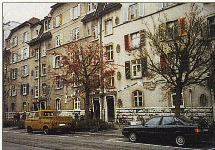
Renovation in ehemals besetzten Häusern in Basel (Bild links): Alfred Kaufmanns Bauteilladen (oben) lieferte Kochherd, Dusche und Durchlauferhitzer in erster Secondhand-Qualität.