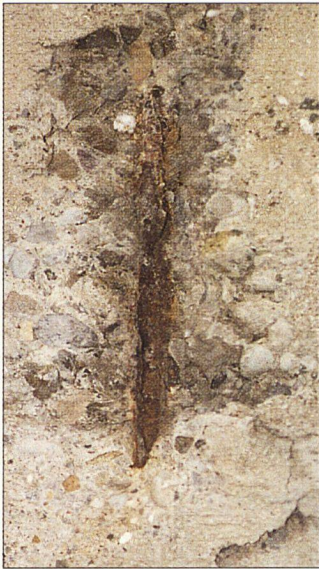
Freiliegender rostender Bewehrungsstab

Die Meldungen in der Tagespresse über millionenteure Instandsetzungen von erst 20- bis 30jährigen Gebäuden aus Stahlbeton lassen aufhorchen. Für Verwalter oder Eigentümer ähnlicher Bauwerke drängt sich die Frage auf, wie sich solche Kosten vermeiden lassen.