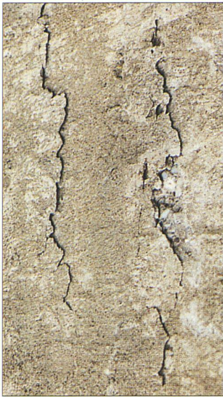
Entstehung von Rissen

Risiko, und der Unterhaltsplan kann auf den effektiven Zustand der Bausubstanz angepasst werden.