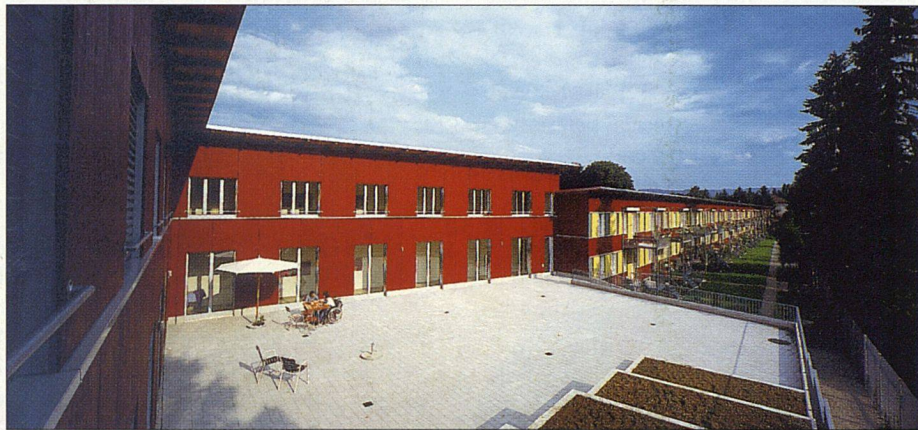
Einstellhalle im Niederholzboden: Parkplätze für die Katz

AUTO TEILEN Ein anderes Vorgehen zeigt sich bei einer derzeit im Bau befindlichen Siedlung mit 100 Wohneinheiten in Wattwil (Kanton St. Gallen). Die Gemeindebehörde bewilligte einen Versuch mit Carsharing-Parkplätzen