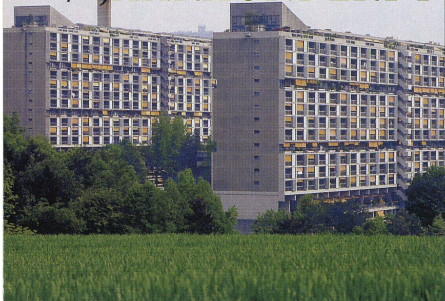
Wohnmaschinen aus den 60er Jahren: Siedlung Gäbelbach

DER NOT GEHORCHEND... 1945. Der Krieg war zu Ende, die Wohnungsnot gross. Durch die nun stark zunehmenden Eheschliessungen und Geburten wurde sie noch verschärft. Auch in Bern fehlten Hunderte von Wohnungen. In zahlreichen Altbauten mangelte es ausserdem an jeglichem Komfort und elementarster Hygiene – zu lange wurden vielerorts dringend nötige Sanierungen infolge der hohen Baukosten aufgeschoben. Es war absehbar, dass weder die Gemeinde noch der private Wohnungsbau in nützlicher Frist und zu tragbaren Bedingungen Abhilfe schaffen konnten.