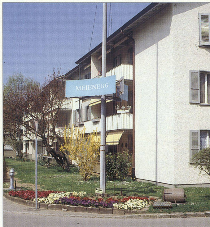
Weit über 40jährig und wieder fast wie neu: Die Meienegg.