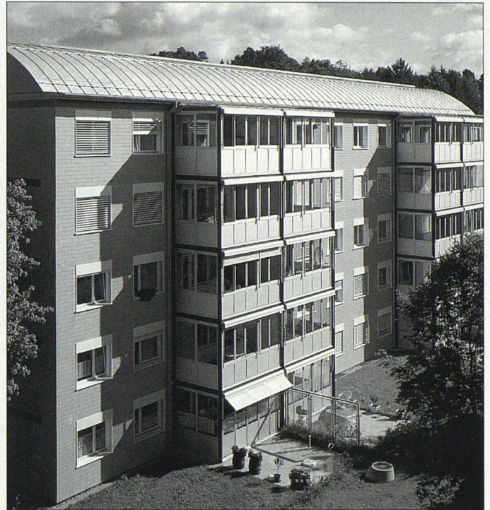
Von den Bausünden aus den 70er Jahren ist nichts mehr zu sehen. Nach nur elfmonatiger Bauzeit sieht «Göhnerswil» einer neuen Zukunft entgegen.

gleichzeitig den Wohnwert. Die vorherigen Flachdächer wurden mit Tonnendächern überdeckt und die Garagenplätze um 55 Parkplätze im Unterniveaubereich erweitert. Alles in allem ein sehr komplexes Unterfangen, was dennoch eine reine Bauzeit von nur elf Monaten benötigt hatte. Neben den grösseren Sanierungsaufgaben, wie der neuen, wärmegeprägten Fassadenverkleidung, wurden auch Erneuerungen in den Bereichen Fenster, Storen und Verglasungen notwendig. Da die Siedlung der Lärmbelastung des naheliegenden Militärflugplatzes ausgesetzt ist, waren nach der Lärmschutzverordnung Fenster mit einem Schallschutzwert von 38 dB erforderlich.