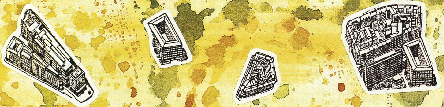
Illustration Joëlle Lanoë

für eine demokratische Stadtentwicklung im Gespräch