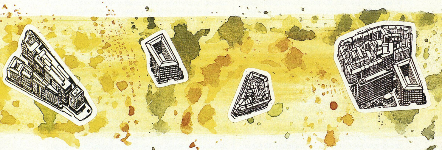
Illustration Joëlle Lanoë

für eine demokratische Stadtentwicklung im Gespräch