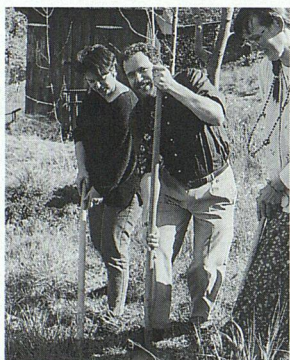
Startschuss für 14 neue Wohnungen.

Die junge Genossenschaft Wohnsinn! tat im April ihren ersten Spatenstich. In der Überbauung Cholenrain, unmittelbar neben ei-