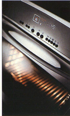
Blick in die Zukunft – Kochherd von Electrolux (Swissline 2000 EB SL 6).