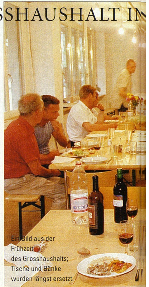
Ein Bild aus der Frühzeit des Grosshaushalts; Tische und Bänke wurden längst ersetzt.