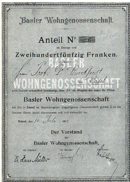
Einer der ersten Anteilscheine der BWG. Die 250 Franken konnten in wöchentlichen Einzahlungen von 50 Rappen beglichen werden.