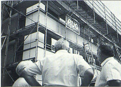
Der grosse Umbau in Windisch interessierte...