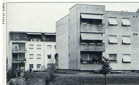
Aufwertung von Bauten aus den 60er Jahren: Im Vordergrund ein noch nicht sanierter Block. Im Hintergrund ein identisches Gebäude nach der Sanierung.

Für die vorbildliche Erhaltung und Anpassung der Siedlung Geissenstein ist der Heimatschutzpreis 1999 an die Eisenbahnerbaugenossenschaft Luzern EBG verliehen worden. Damit wurde das Werk eines Vorstandes ausgezeichnet, der die Erhaltung des Hergebrachten mit der Förderung des Neuen zu verbinden weiss und dabei alles andere als den Weg des geringsten Widerstandes gegangen ist.