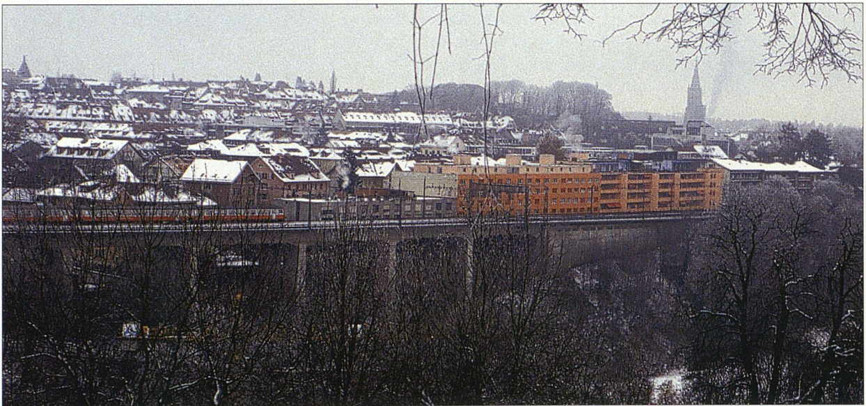
Beim Blick auf Bern fällt das langgezogene, rote Gebäude am Bahngleis auf.