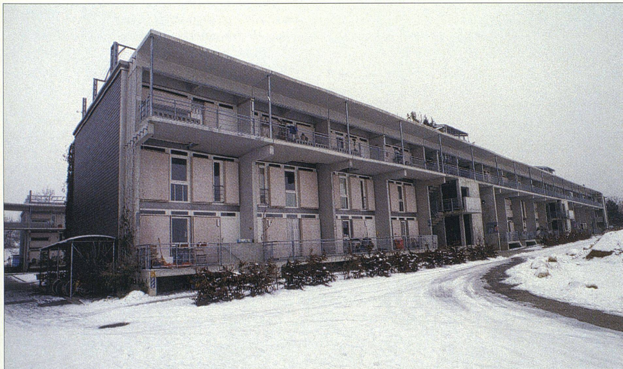
Besonders im Winter wirkt die moderne Betonsiedlung «Baumgarten» kalt und abweisend.