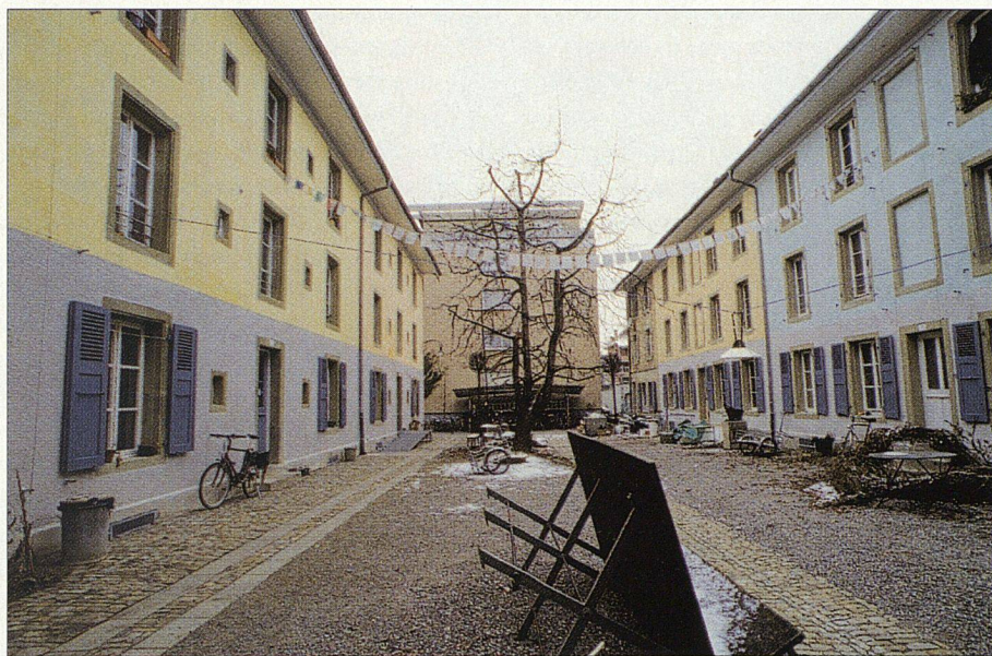
Die verschiedenen Farben geben dem Q-Hof, einem genossenschaftlichen Wohnhaus, eine Struktur.