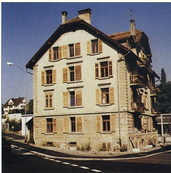
Lärmgeplagt und sanierungsbedürftig: das Haus an der Maihofstrasse in Luzern.

grundlage hatte die Geschäftsstelle eine Kostenrechnung vorbereitet. Daraus gingen die verschiedenen denkbaren Ausbau-Varianten mit ihren finanziellen Konsequenzen auf den monatlichen Mietzins der Wohnungen hervor. Das Auffrischen der eigenen Wohnung übernahmen die Bewohner/innen, die GSW stellte jedoch für die Materialkosten bis 700 Franken pro Wohnung zur Verfügung. ➤